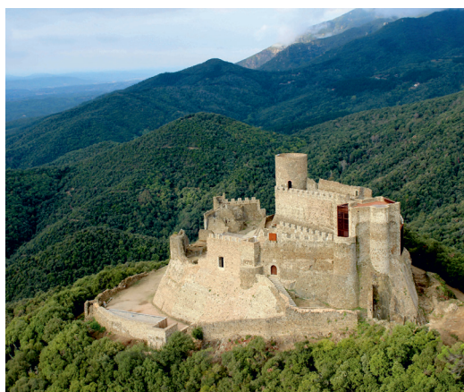
Figura 1. Imatge aèria del Castell de Montsoriu als peus del Montseny.